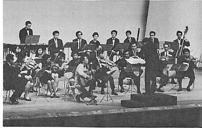
●ギターの祭典にて コンチェルトを演 奏