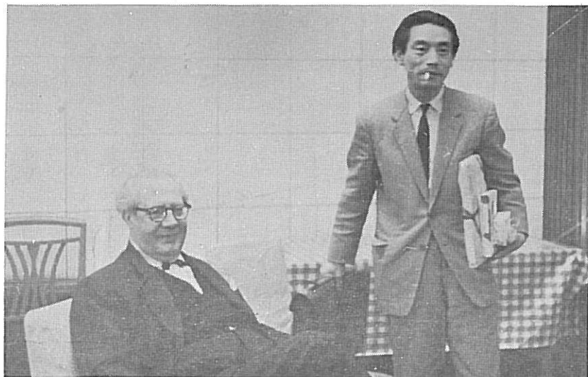
●来日のセゴビア と共に