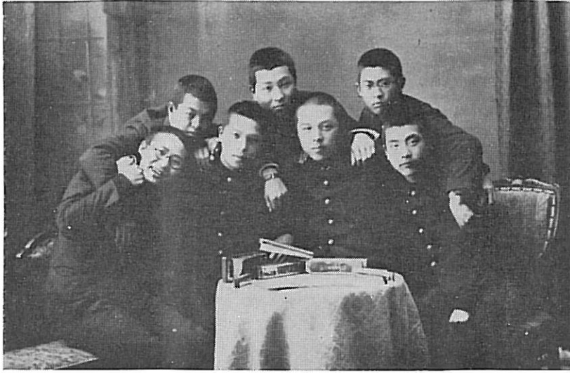
●旧制中学時代 ハーモニカ・ クラブの仲間 と(前列右端)