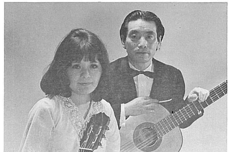
●父娘ジョイント リサイタル